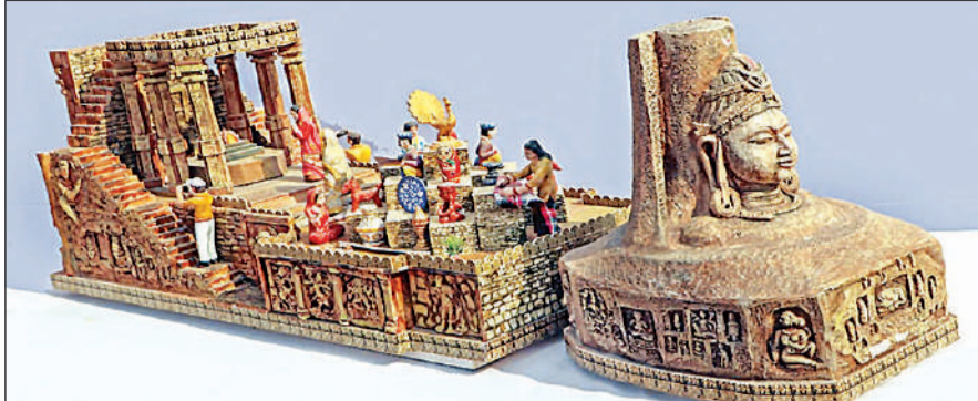
गणतंत्र दिवस पर नई दिल्ली में निकलने वाली परेड में यूपी के बुंदेलखंड की सांस्कृतिक विरासत की झांकी का मॉडल।

अमृत विचार: गणतंत्र दिवस के अवसर पर दिल्ली के कर्तव्य पथ पर आयोजित राष्ट्रीय परेड में उत्तर प्रदेश की झांकी इस वर्ष भी दर्शकों के आकर्षण का केंद्र बनेगी। मुख्यमंत्री योगी आदित्यनाथ के निर्देश पर तैयार यह झांकी बुंदेलखंड की गौरवशाली सांस्कृतिक विरासत और आधुनिक उत्तर प्रदेश की तेज विकास यात्रा को एक साथ प्रस्तुत करेगी। झांकी के माध्यम से यह संदेश दिया जाएगा कि प्रदेश अपनी परंपराओं को सहेजते हुए विकास की नई ऊंचाइयों को छू रहा है। झांकी के अग्रभाग में बुंदेलखंड के ऐतिहासिक कालिंजर दुर्ग