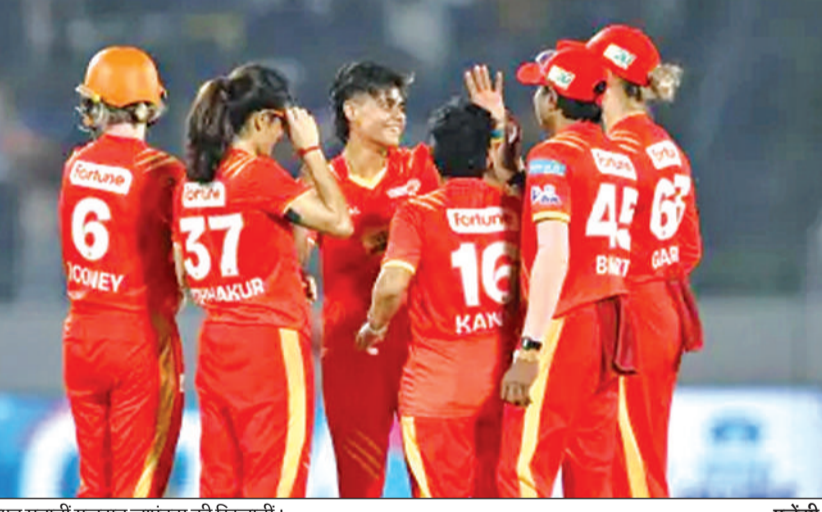
जीत का जश्न मनाती गुजरात जाएंट्स की खिलाड़ी।