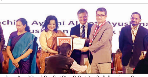
भुवनेश्वर में आयोजित दो दिवसीय 'चिंतन शिविर' में यूपी की टीम हुई सम्मानित।

आयुष्मान भारत योजना पर केंद्रित इस चिंतन शिविर का आयोजन राष्ट्रीय स्वास्थ्य प्राधिकरण द्वारा स्वास्थ्य एवं परिवार कल्याण मंत्रालय के अंतर्गत, ओडिशा