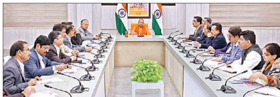
कम्प्लायंस रिडक्शन और डी-रेगुलेशन फेज-II के तहत चल रहे सुधारों की उच्चस्तरीय समीक्षा करते मुख्यमंत्री योगी।

मुख्यमंत्री ने कहा कि कम्प्लायंस रिफॉर्म के फेज-I में उत्तर प्रदेश ने देशभर में एक मजबूत पहचान बनाई है और अब फेज-II के माध्यम से इन सुधारों को स्थायी और संस्थागत रूप दिया जाना है। यह चरण केवल नियमों में बदलाव तक सीमित नहीं है, बल्कि प्रशासन की कार्यप्रणाली और सोच में परिवर्तन का माध्यम है। उन्होंने दोहराया कि डी-रेगुलेशन का अर्थ नियंत्रण समाप्त करना नहीं, बल्कि अनावश्यक नियम हटाकर जरूरी नियमों को सरल, स्पष्ट और पारदर्शी बनाना है। सरकार का संकल्प उत्तर प्रदेश को ईज