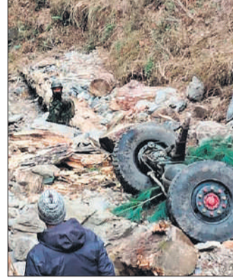
जम्मू में खाई में गिरा सेना का वाहन। दाएं: घायलों को अस्पताल ले जाती टीम।

सैनिकों को आतंकवाद विरोधी अभियान के लिए ले जा रहा सेना का एक बख़्तरबंद वाहन गुरुवार को जम्मू-कश्मीर के डोडा जिले में सड़क से फिसलकर गहरी खाई में जा गिरा, जिससे उसमें सवार 10 जवानों की मौत हो गई और 11 अन्य घायल हो गए। अधिकारियों ने बताया कि यह हादसा भद्रवाह-चंबा अंतर्राष्ट्रीय मार्ग पर लगभग 9,000 फुट की ऊंचाई पर स्थित खन्नी टॉप पर उस समय हुआ, जब सेना के बुलेटप्रूफ वाहन 'कैम्पर' के चालक ने वाहन पर नियंत्रण खो दिया और यह 200 फुट गहरी खाई में जा गिरा। 'कैम्पर' एक 'माइन-रजिस्टर्ड एंबुश प्रोटेक्टेड (एमआरएपी)' वाहन है, जिस सैनिकों को उन संवेदनशील इलाकों से सुरक्षित रूप से गुजरने की सुविधा प्रदान करने के लिए तैयार किया गया है, जहां बारूदी सुरंगें बिछाए जाने या आईईडी (संवेदनित विस्फोटक उपकरण) लगाए जाने की आशंका अधिक होती है। सेना के