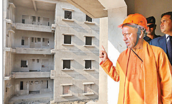
निर्माणाधीन खेल विश्वविद्यालय का निरीक्षण करते मुख्यमंत्री योगी।

'जय हिंद' और प्रतीक चिन्ह का लोकार्पण किया। मुख्यमंत्री योगी ने अधिकारियों को निर्देश दिए कि विश्वविद्यालय में उच्च गुणवत्ता वाली फैकल्टी की नियुक्ति सुनिश्चित की जाए और पूर्ण राष्ट्रीय व अंतरराष्ट्रीय खिलाड़ियों को कोच के रूप में जोड़ा जाए, ताकि प्रशिक्षण में अनुभव और व्यावहारिक ज्ञान का समुचित समावेश हो सके। मुख्यमंत्री ने मीडिया से बातचीत में बताया कि खेल विश्वविद्यालय में 12 खेलों में