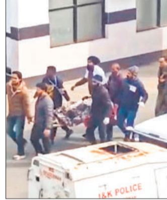
जम्मू में खाई में गिरा सेना का वाहन। दाएं: घायलों को अस्पताल ले जाती टीम।

सैनिकों की मौत पर मोदी ने गहरा दुख जताया नई दिल्ली। प्रधानमंत्री नरेंद्र मोदी ने जम्मू-कश्मीर के डोडा जिले में एक सड़क दुर्घटना में सेना के जवानों की मौत पर गहरा दुख व्यक्त किया। प्रधानमंत्री ने सोशल मीडिया मंच एक्स पर एक पोस्ट में कहा, डोडा में हुए हादसे से गहरा दुख हुआ है, जिसमें हमने अपने बहादुर सैनिकों को खो दिया है। राष्ट्र के लिए उनकी सेवा को हमेशा याद रखा जाएगा। मोदी ने कहा, घायल व्यक्ति जल्द से जल्द स्वस्थ हों। प्रभावित लोगों को हर संभव सहायता प्रदान की जा रही है।