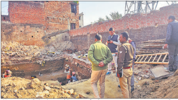
टॉवर लगने के विरोध के बाद मौके पर पहुंची पुलिस।